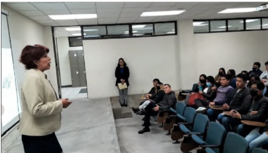
Foto: Carrera de Administración (Gestión de Negocios y Proyectos)